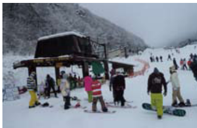
丸山ファミリーペアリフト