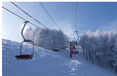
国設第三ペアリフト