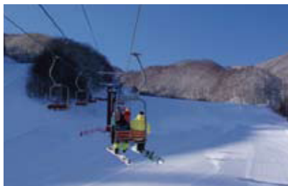
国設第一ペアリフト