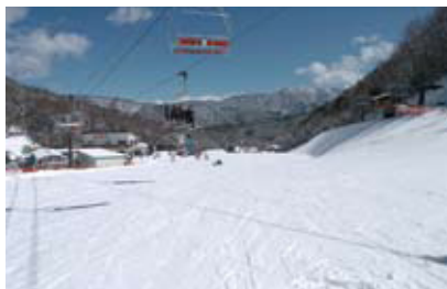
さつきクワッドリフト