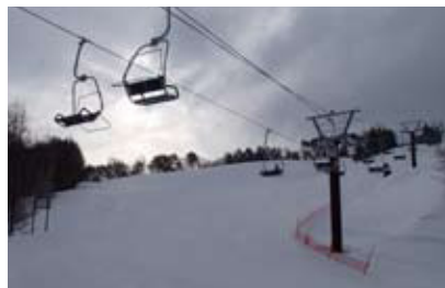
やぶはら中央ペアリフト