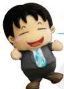
木祖村観光大使「いっせー」