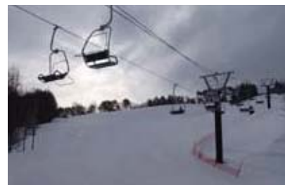
やぶはら中央ペアリフト