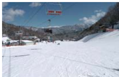
さつきクワッドリフト