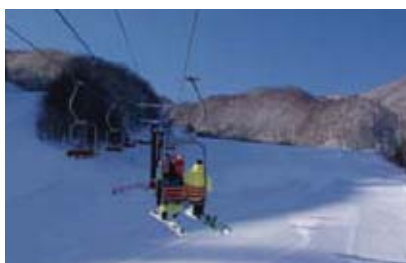
国設第一ペアリフト