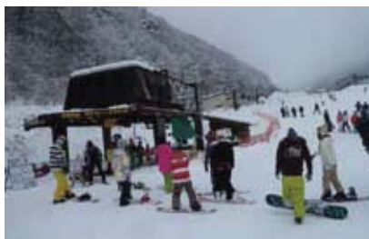
丸山ファミリーペアリフト