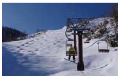
国設第二ペアリフト