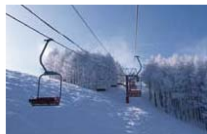
国設第三ペアリフト